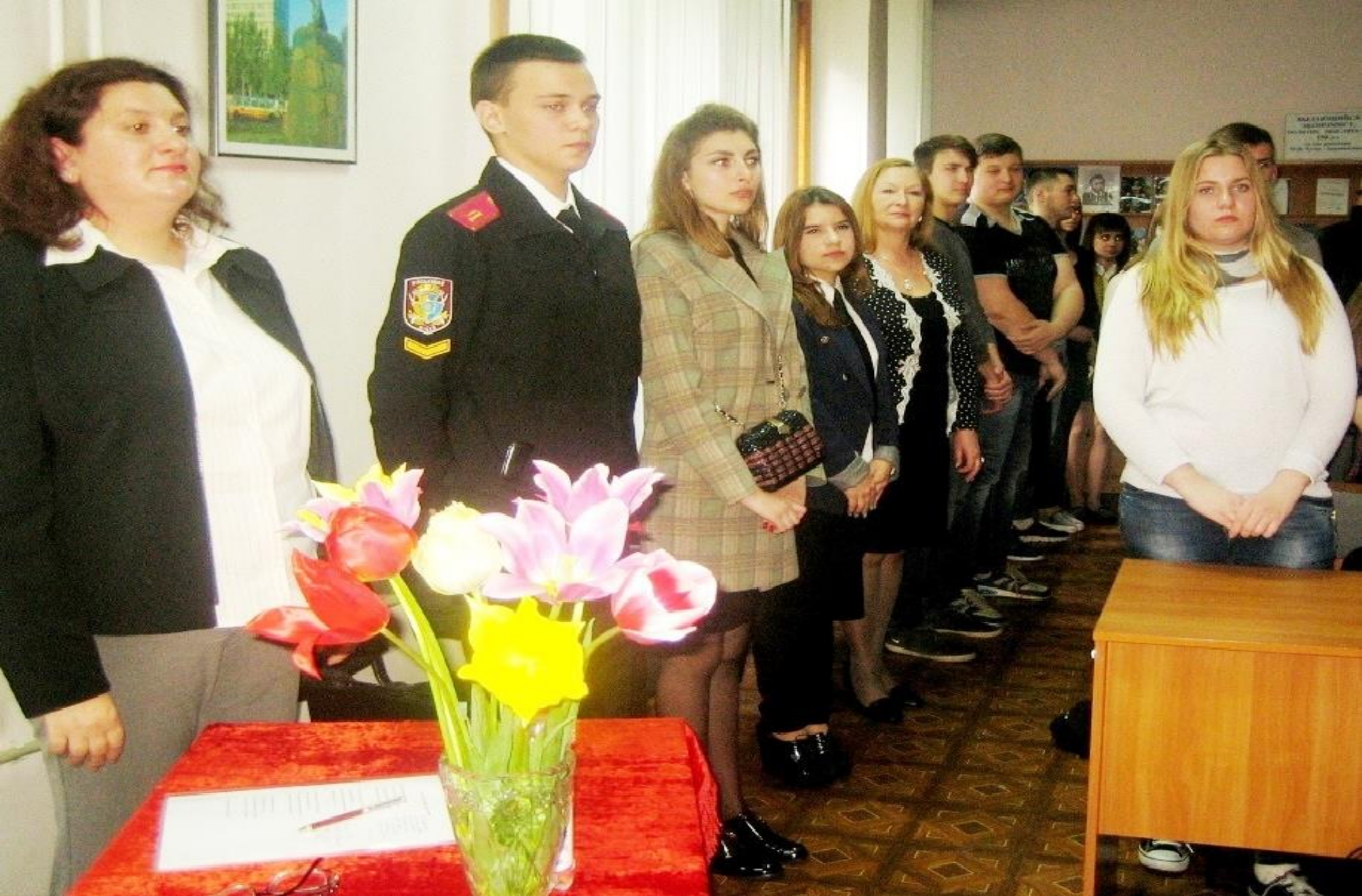
Минутой молчания присутствующие почтили память погибших в Великой Отечественной войне