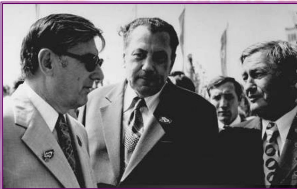
Высокопоставленные гости выставки Уголь-75