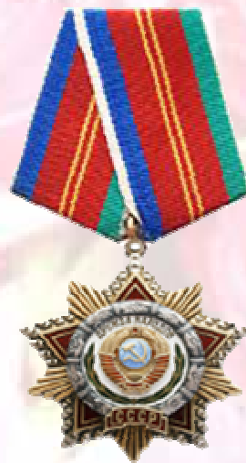
Орден Дружбы Народов (1973 г.)