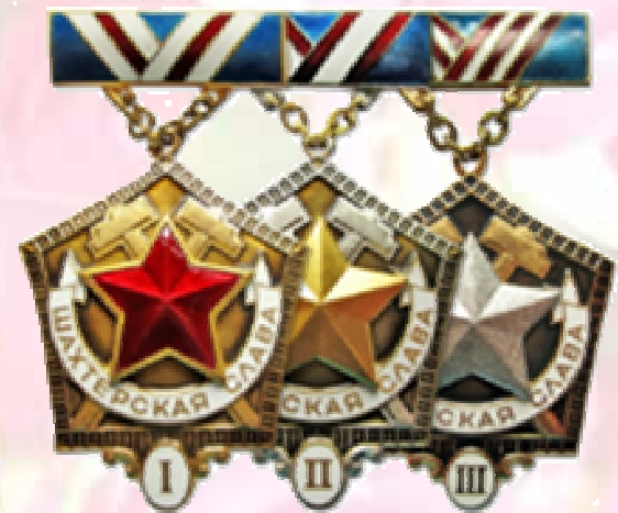
Нагрудный знак «Шахтерская слава» трех степеней