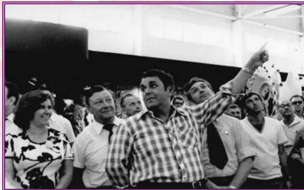
Первый секретарь Донецкого обкома партии Владимир Иванович Дегтярёв