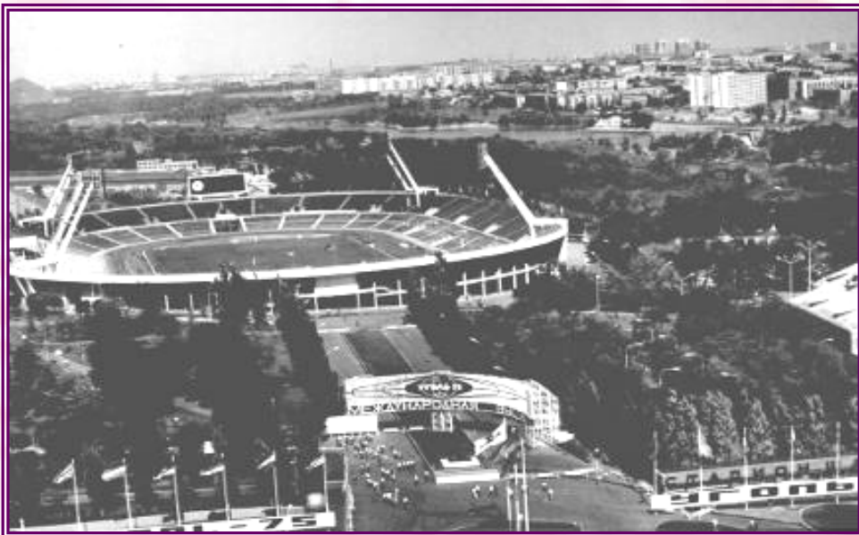
Вход на выставку Уголь-75. На заднем плане — центральный стадион Шахтер