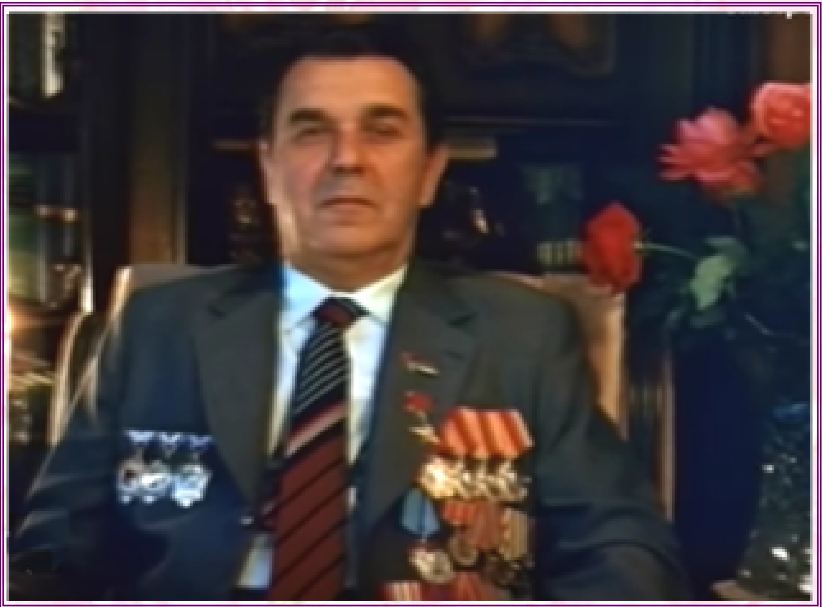
Владимир Иванович Дегтярёв, октябрь 1993