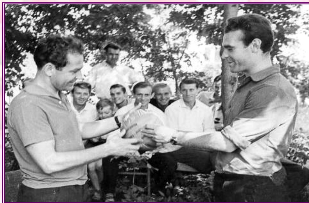
Космонавт Герман Титов встречается с футболистами на базе Кирша