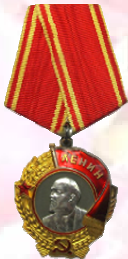
Четыре Ордена Ленина (1957, 1966, 1970, 1973 гг.)