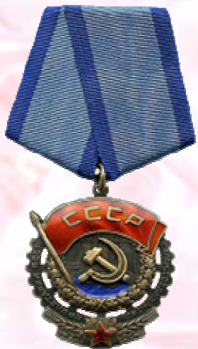
Орден Трудового Красного Знамени (1947 г.)