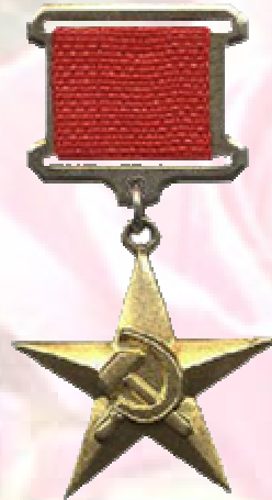
Герой Социалистического Труда (с вручением золотой медали «Серп и Молот» (1957 г.)