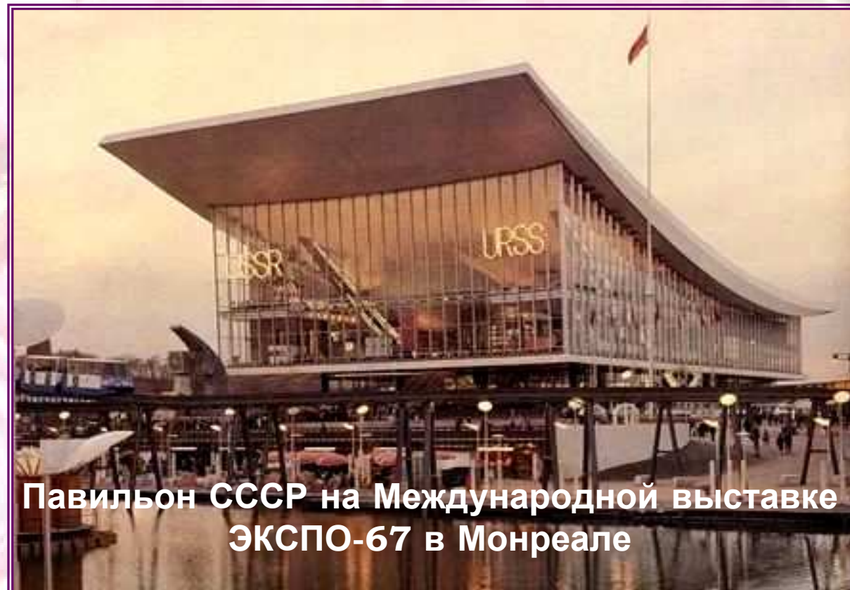
Павильон СССР на Международной выставке ЭКСПО-67 в Монреале

На всемирной выставке в Монреале «ЭКСПО-67» в разделе «Угольная промышленность» был представлен красавец Донецк. На шестиметровом поворотном круге была смонтирована панорама современной крупной донецкой шахты. Здесь экспонировались модели лучших очистных и проходческих комплексов, работающих в шахте. Многих посетителей привлекал раздел «Донецкий угольный бассейн и город Донецк». Перед посетителями была открыта движущаяся панорама Донецка — единственного города в мире, в котором угольные шахты органически слились с его архитектурой и планировкой, где рядом с терриконами расположились стадионы, театры, пляжи, цветы.