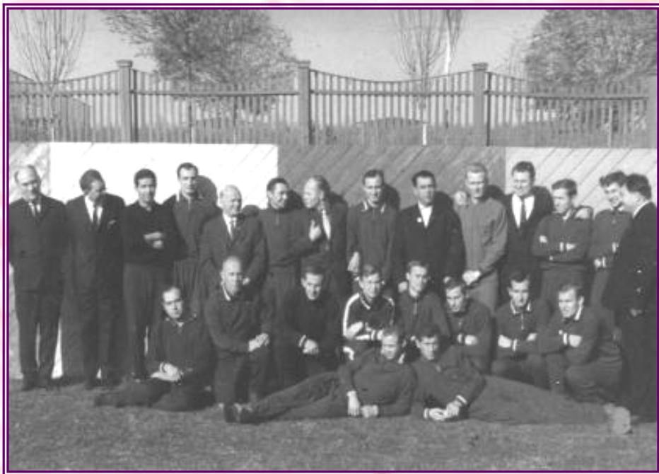
Члены бюро обкома партии на база Кирша