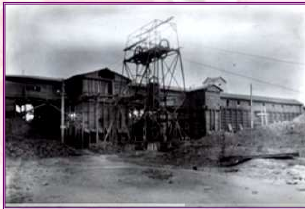
Шахта № 7 треста «Хакассуголь»