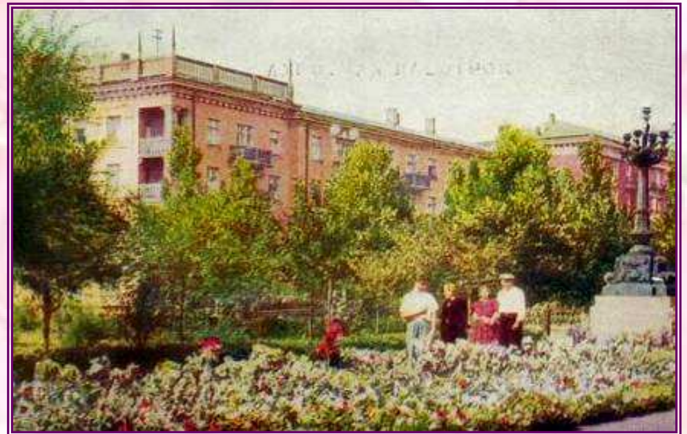
Бульвар Пушкина в 70-х годах